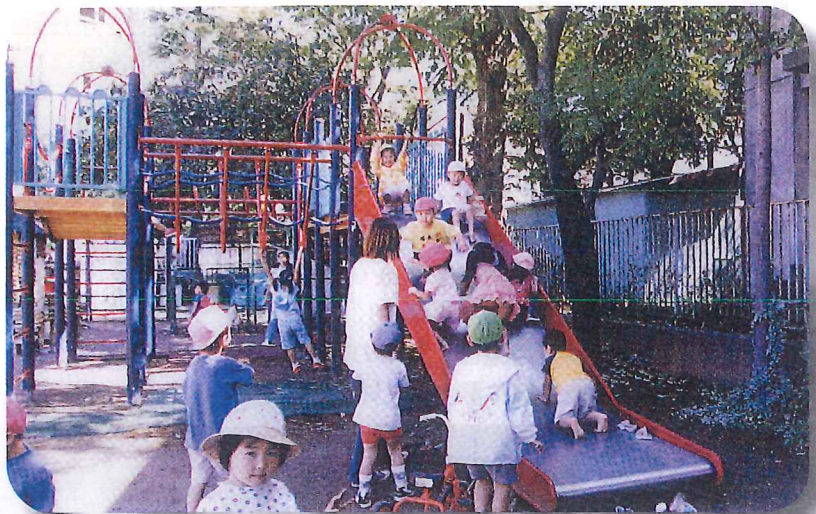
大好きなすべりだい