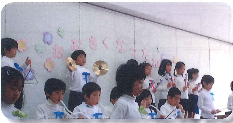
生活はっぴょうかい