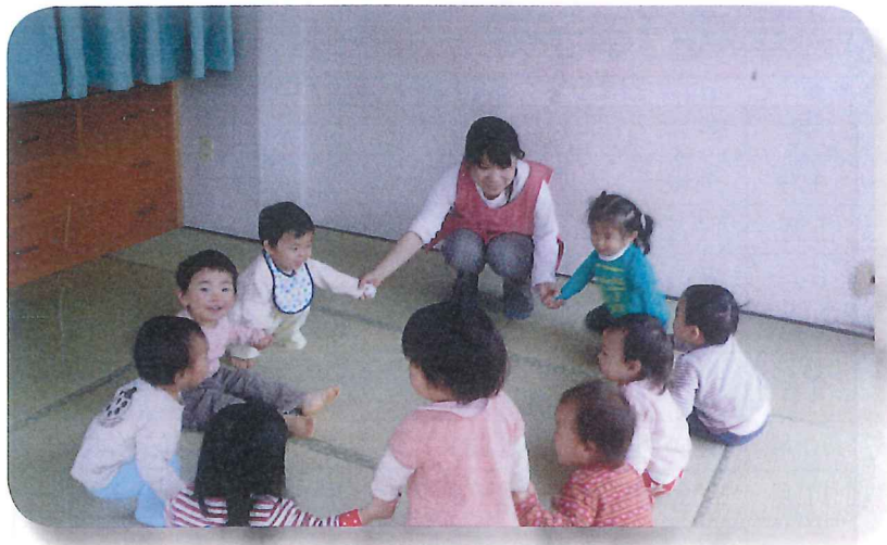
わらべうたあそび